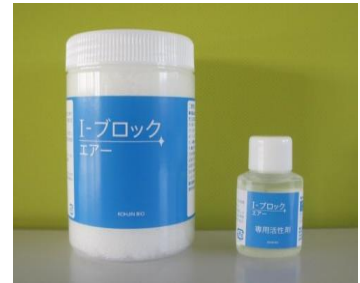
I-ブロックエア本体・専用 活性化剤