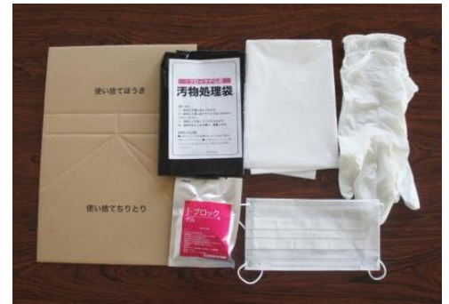
嘔吐物処理に必要な物がひとまとめになっています